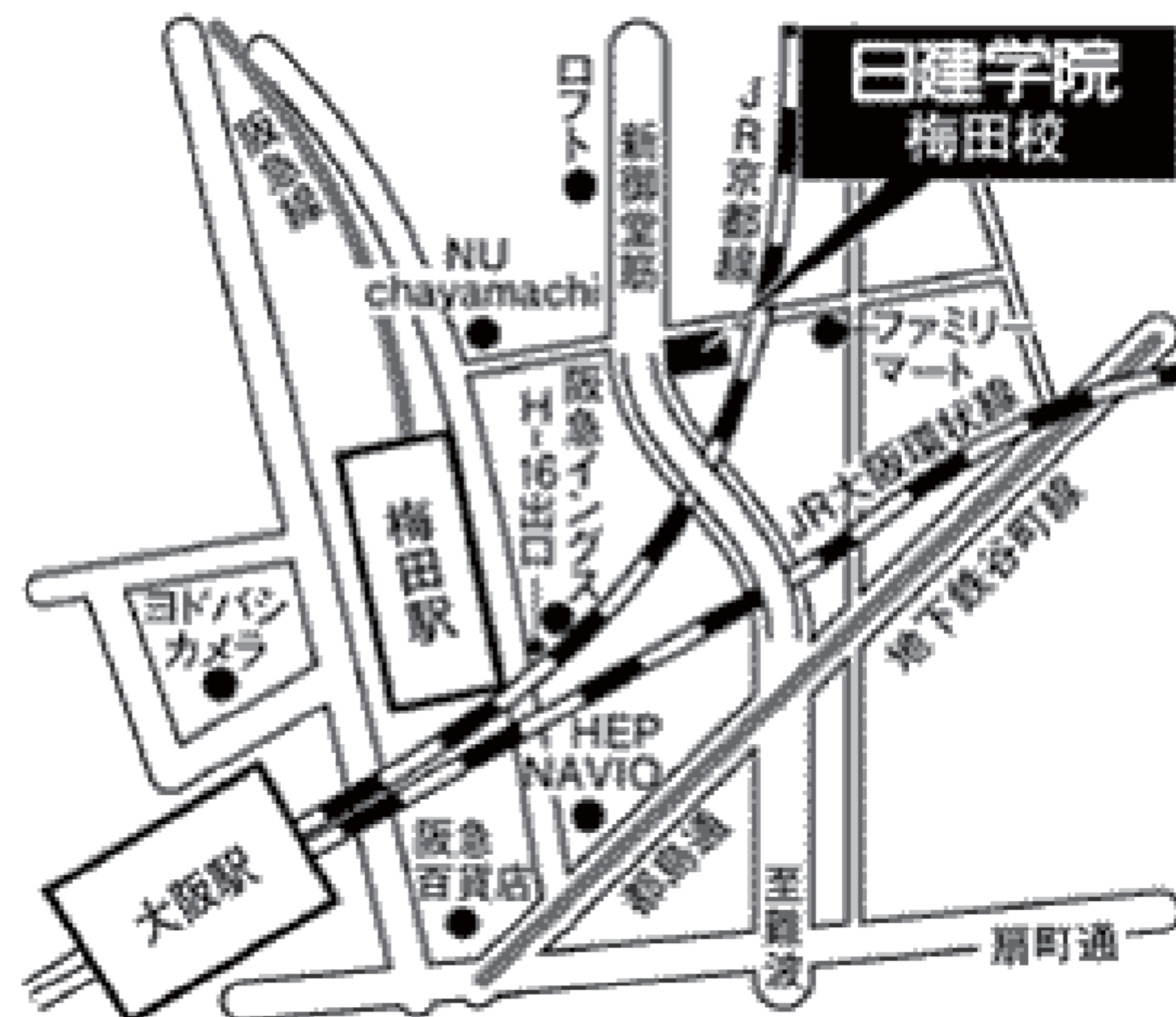
■アクセス JR 大阪駅・梅田駅 (阪急、地下鉄御堂筋線)